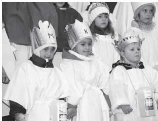
Koledníci z Lanžhota berou své poslání vážně podobně jako dalších osm tisíců tříkrálových dobrovolníků na celé jižní Moravě