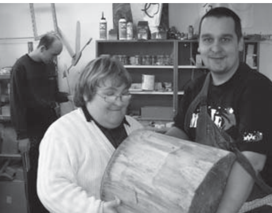
Dřevařská dílna rozvíjí dovednosti klientů Stacionáře sv. Damiána ve Znojmě