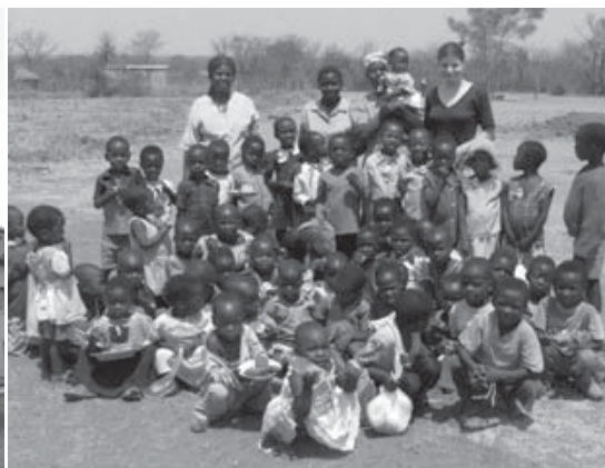
Dobrovolnická mise v Zimbabwe umožnila odstartovat projekt na podporu školní docházky a péče o předškolní děti