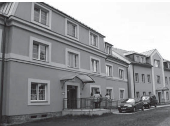
Domov pokojného stáří v Janštejně otevřel své brány potřebným