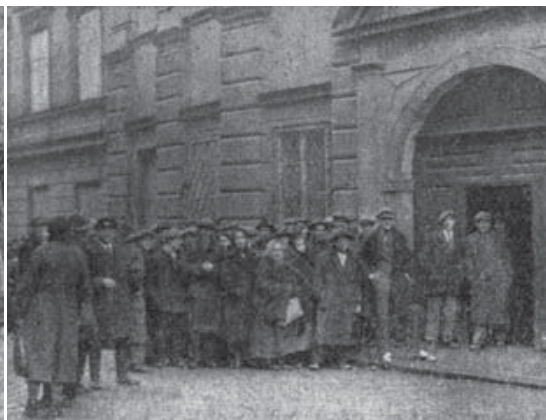
Nezaměstnaní v Biskupské ulici u bran tehdejšího sídla Charity

Z vlastních prostředků tehdy vydržoval brněnský Svaz Charity tyto ústavy :