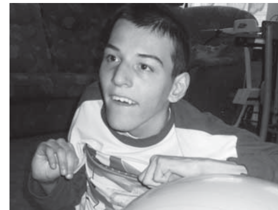
Takto vypadá štěstí v denním stacionáři NESA pro lidi s mentálním postižením a kombinovanými vadami ve Valašském Meziříčí OCH Žďár nad Sázavou

V kanceláři na pracovníky Charity často čekají hromady dokumentů, jenž nestačí radit do šanonů. Jedním z nich je kopie lékařské zprávy, která lakonicky popisuje onemocnění rakovinou lymfatických uzlin. Je to jen papír, za ním se však skrývá