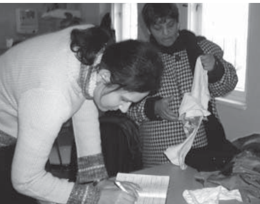
Lidé bez domova v Hodoníně mohou využít služby denního centra a šatniku