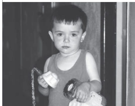
Děti v pobytovém středisku pro čekatele na azyl a migranty v Zastávce vděčně vítají aktivity, které pro ně organizuje Oddělení migrace DCHB