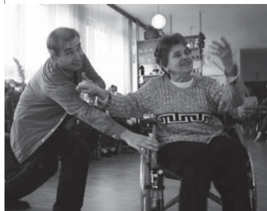
Tanec na vozíčku není ničím výjimečným v Domovince pro seniory a zdravotně postižené v Třebíči

Děti z Běloruska na ozdravném pobytu ve Znojmě v roce 1993 dostaly od znojemské firmy Dapo dva páry obuvi