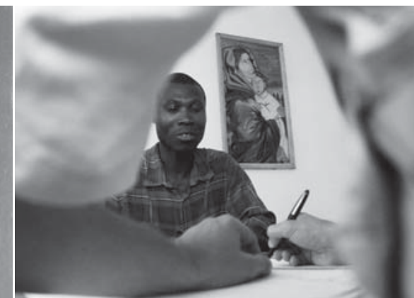
Poradna pro cizince